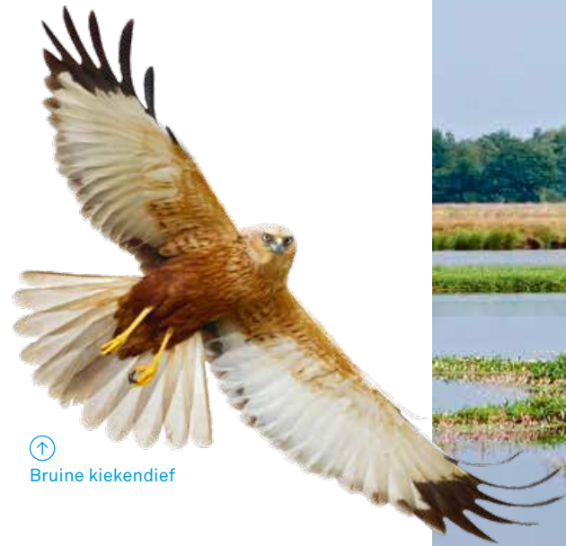
↑ Bruine kiekendief