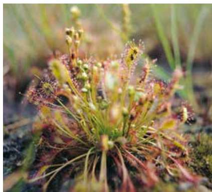
↑ Kleine zonnedaauw