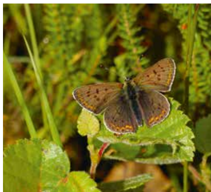
← Bruine vuurvliinder